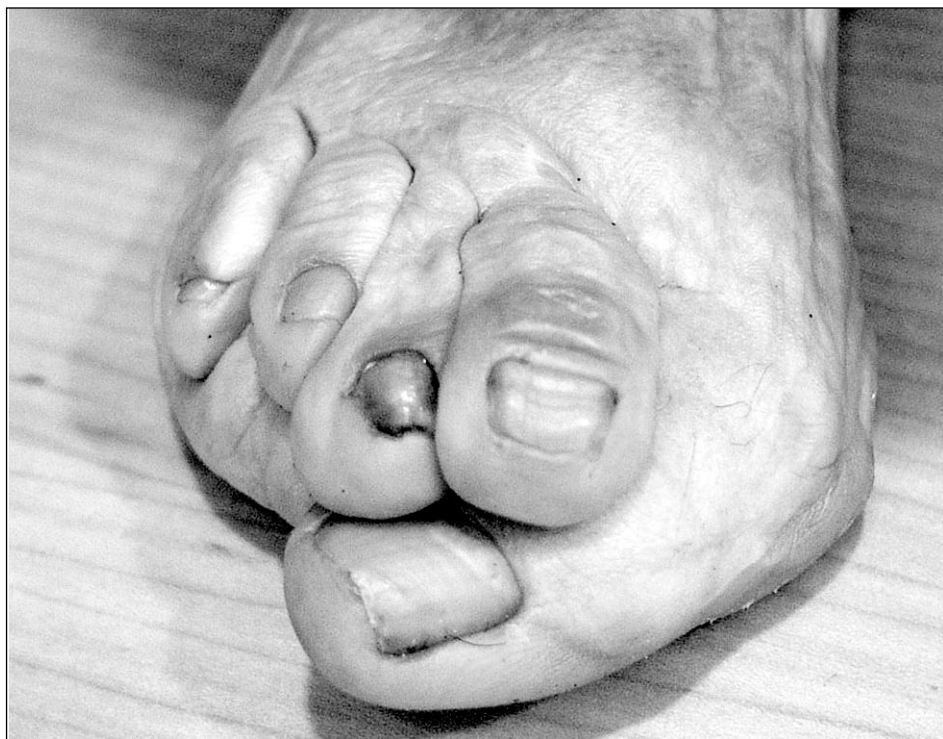
Pie antes de la operación.